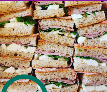
Planche Premium 10 pers. Charcuterie/fromages italiens avec focaccia nature